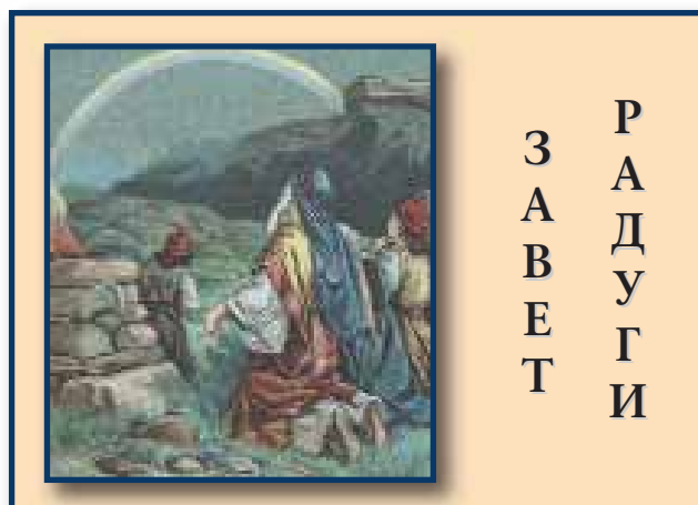
ФОТОДРАМА СОТВОРЕНИЯ или Библейская история в картинках.