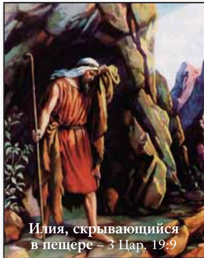
Илия, скрывающийся в пещере – 3 Цар. 19:9

ОЧИЩЕНИЕ святилища истинной Церкви имело свои ранние начала в реформационных учениях Иоганна Весселя, первого члена звезды и «князя» Филадельфийской Церкви (Мих. 5:5; Е4, 114 стр.; Е5, 197, 198 стр.; Е8, 673 стр.; Е13, 838 стр.). Голос трубы провозглашался следующими звездами, которые формировали «пастыря» данного периода, особенно со времен Лютера (РЗ, 108-120 стр.), когда папские заблуждения темных веков на тему Жертвы Христа, веками порочившие Церковь, были опровергнуты и отвергнуты, когда одиннадцать реформаторов Малого Стада представляли и защищали вверенные им доктрины.