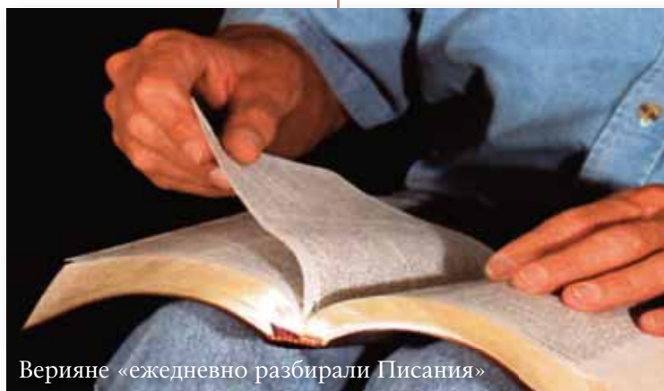
Верияне «ежедневно разбирали Писания»

Это было 38 лет назад. Благодаря Господнему благословению я нашел Ключ к объяснению Священного Писания – не по причине своих способностей, но, как я верю, потому что пришло время понять Библию – в конце этого Христианского Века и в рассвете Тысячелетнего Дня.