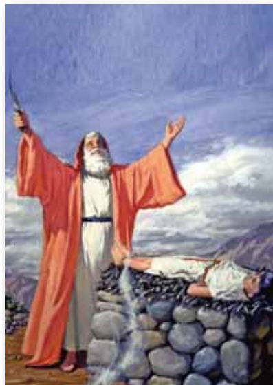
АВРААМ ПОСЛУШЕН БОГУ

Отче, какова Твоя воля? Укажи мне, какова она, сделай так, чтобы я мог ее понять; я готов, я хочу и жажду делать все то, что записано в Твоей Книге – все, что Ты мне предопределил.