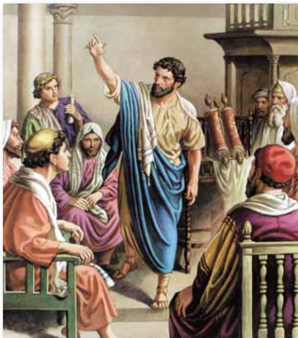
СВЯТОЙ ПАВЕЛ ОБРАЩАЕТ ВНИМАНИЕ НА «ЦЕРКОВЬ ПЕРВОРОДНЫХ»

Б ЕЗ СОМНЕНИЯ, все мы помним, что не так давно прошла годовщина вознесения нашего дорогого Искупителя одесную Отца – после Распятия, на самое высокое место во вселенной, следующее после Всемогущего Отца (в 33 г. Р.Х., Дан. 9:25-27). Он взошел туда, где был прежде, на духовный уровень существования, с большим совершенством славы и чести, который стал наградой за Его верность и послушание воле Отца до принесения в жертву Своей жизни на Голгофе. Он взошел, как говорит Священное Писание, из более низкого состояния человеческой природы, которая немного ниже природы ангелов, к возвышенному состоянию Божественной природы, значительно выше ангелов, начальств и власти и всякого именуемого имени (Евр. 2:9; Фил. 2:8-11). Дело, ради которого Логос оставил небесную славу, еще не было до конца завершено. Он страдал, праведный за неправедных, отдавая Свою жизнь как цену выкупа за всех (1 Пет. 3:18; 1 Тим. 2:6), но это было только средством достижения цели, а эта цель еще не достигла благословения Адама и его падшего рода. Благодарность Богу за то, что это великое подготовительное дело продвигается на протяжении девятнадцати столетий с момента Его вознесения. Это подготовительное дело, приготовление Церкви Христовой, наследующей Его в верности и самопожертвовании, для них уже было завершено и они теперь прославлены с Ним до Божественной природы, славы, чести и бессмертия, которые были Его, а теперь являются также их наградой (2 Пет. 1:4).