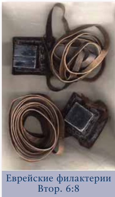
Еврейские филиактерии Втор. 6:8

в четырех столбиках (Исх. 13:1-16; Втор. 6:4,11, 13-21). Эти филиактерии евреи иногда привязывали к своей голове, по центру над глазами, или прикрепляли корбочку на внутренней стороне локтя и завязывали ремешок на руку, держа конец в ладони. Бедные евреи! Они искренне придерживались внешней формы, но, как показал