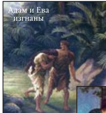
Адам и Ева изгнаны

Следующей гарантией благословения, которое принесет установленное Царство, является полученное заверение в том, что в числе первых дел нашего Господа во время Его второго при-