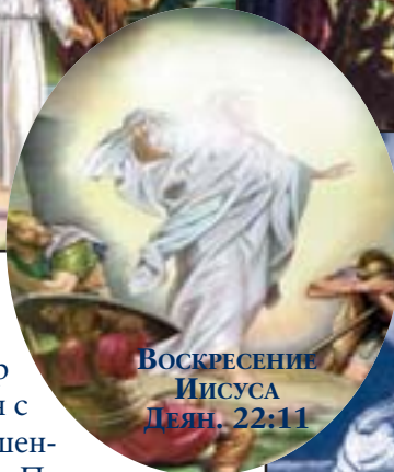
Воскресение Иисуса Деян. 22:11