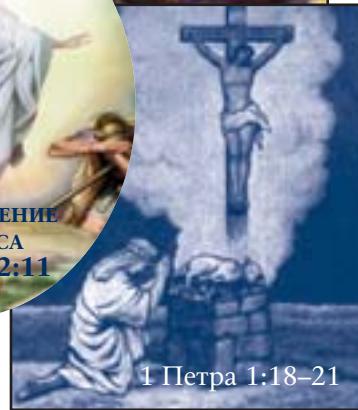
1 Петра 1:18–21